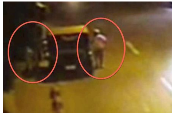
ຮູບຖ່າຍຈາກພາບກ້ອງວົງຈອນປິດ ເປັນຊ່ວງທີ່ສົມບັດ ສົມພອນອອກຈາກລົດຈີບເພື່ອໄປລົມກັບຕໍາຫຼວດ.